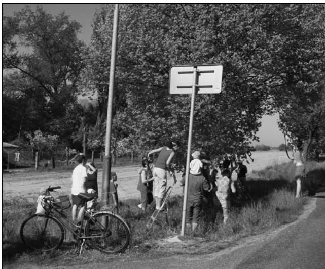
Poděkování patří všem, kteří se zdobení zúčastnili.