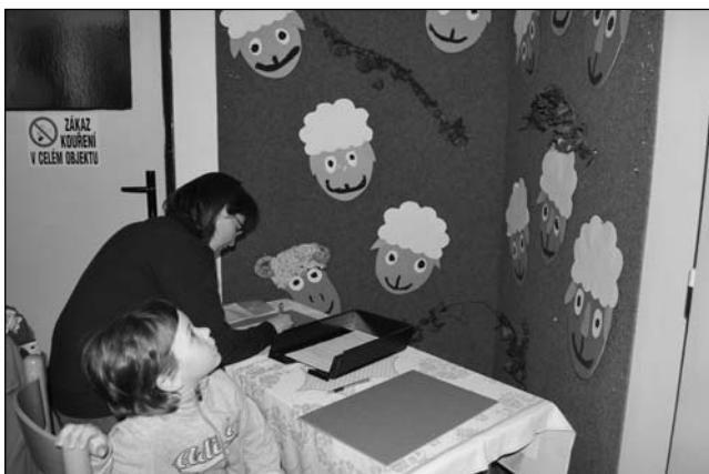
Zápis do MŠ - 4. dubna