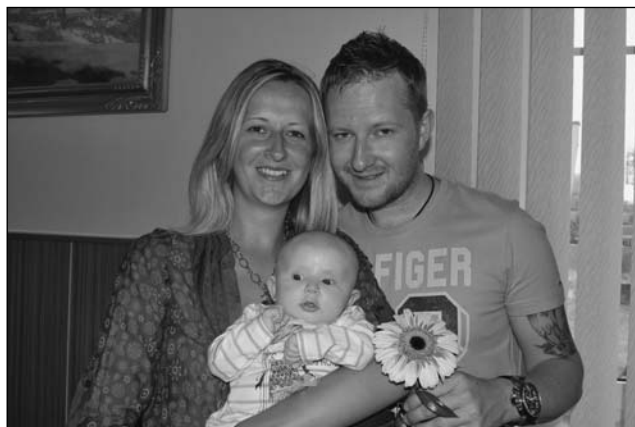
... a Sofinku.