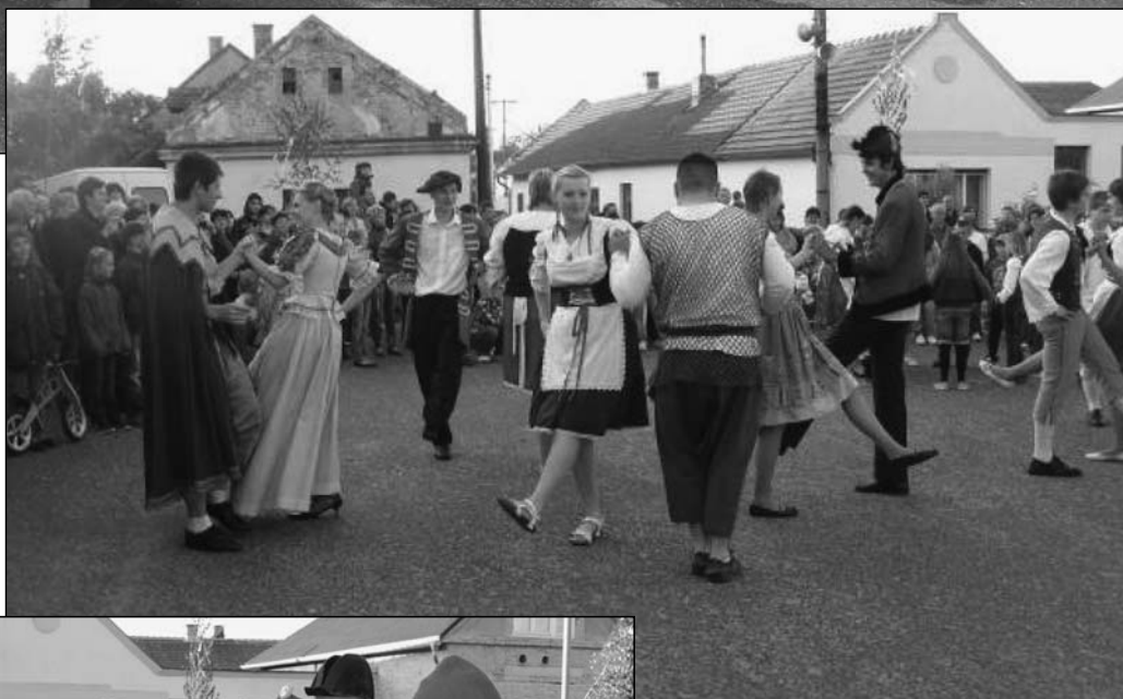
Staročeské Máje 2012

Tradičně proběhly v Kostomlatech Staročeské Máje, které letos připadaly na 12. května. I když dopolední počasí doprovázené deštěm vypadalo hrůzostrašně, odpoledne se umoudřilo. Velké přípravy začaly už