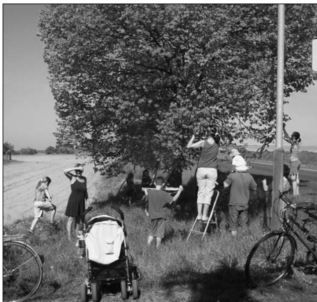
1. května se uskutečnilo v Rozkoši zdobení stromu.