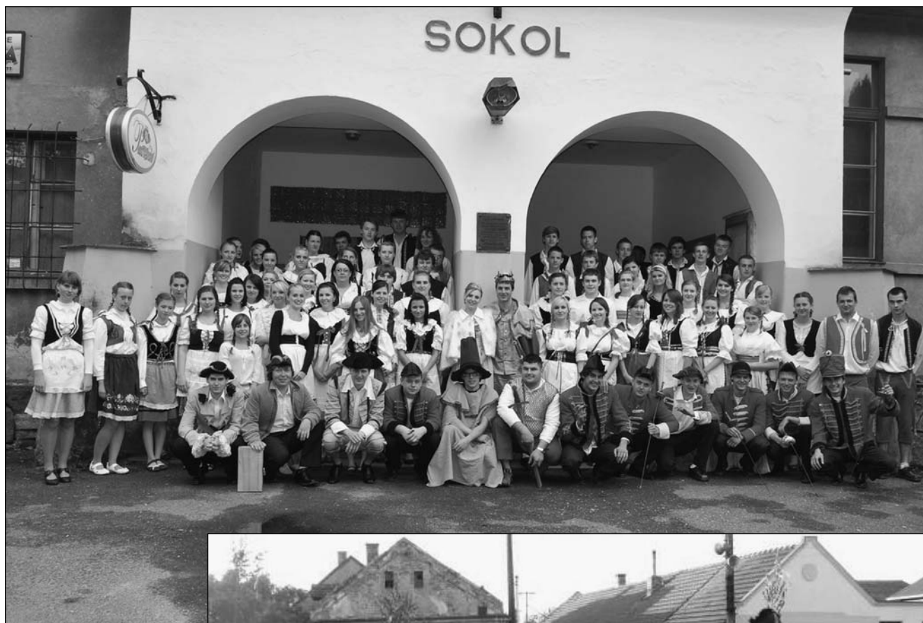
Společná fotografie

Tradičně proběhly v Kostomlatech Staročeské Máje, které letos připadaly na 12. května. I když dopolední počasí doprovázené deštěm vypadalo hrůzostrašně, odpoledne se umoudřilo. Velké přípravy začaly už