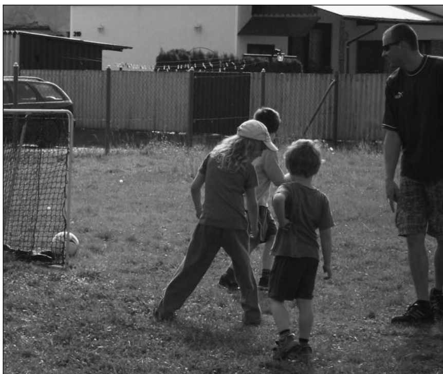
8. 5. se konal druhý ročník fotbalového turnaje rodin.